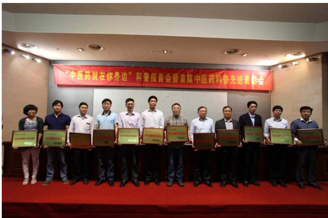
首届中医药科普工作先进集体