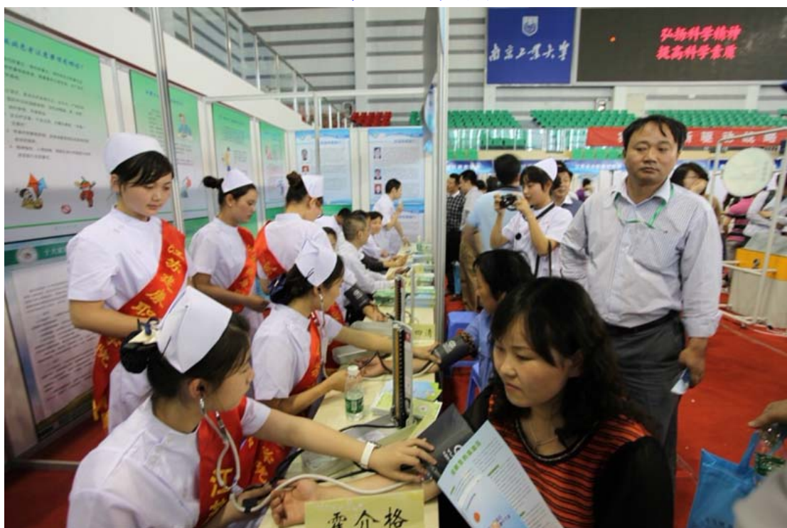
省中医药学会专家义诊现场