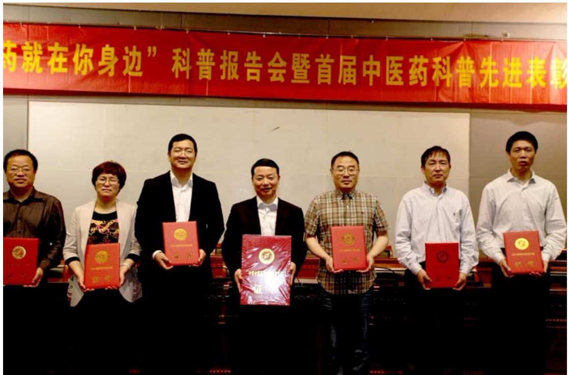
首届中医药科普工作先进个人