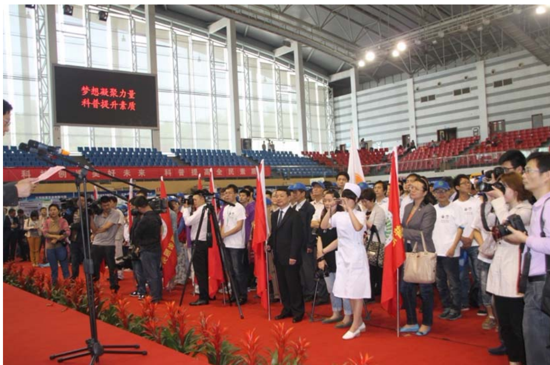
启动仪式现场二 (南京工业大学浦口校区体育馆)